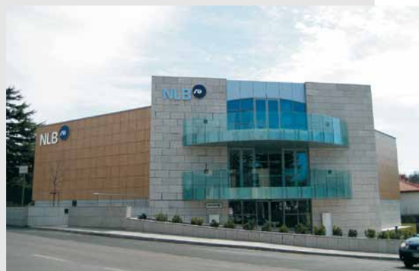
Nova poslovna stavba NLB Podružnice Trst na Opčinah

leti prijetno hladni. Zbrane in z UV-filtri razkužene meteorne vode se ponovno uporabljajo, tudi za zalivanje zelene okolice.