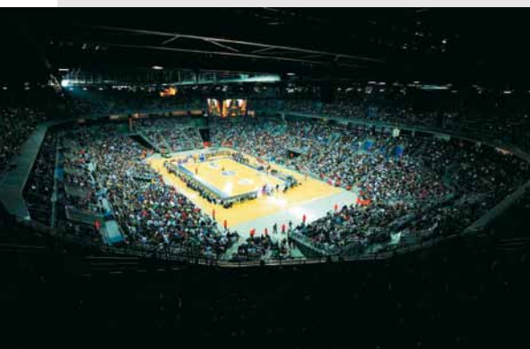
16.000 gledalcev v Zagreški Areni

Letošnji zaključni turnir NLB Lige Final Four je letos od 23. aprila do 25. aprila gostil Zagreb. Na turnirju, ki je potekal v novo zgrajeni dvorani Arena, so se za zmagovalca prvič potegovali kar trije košarkarski klubi, ki igrajo v Evroligi: KK Union Olimpija, KK Cibona in KK Partizan, priključil pa se jim je tudi KK Hemofarm Stada. Na koncu je slavil KK Partizan, ki se je že čez nekaj dni odpravil še na veliki finale Evrolige v Pariz.